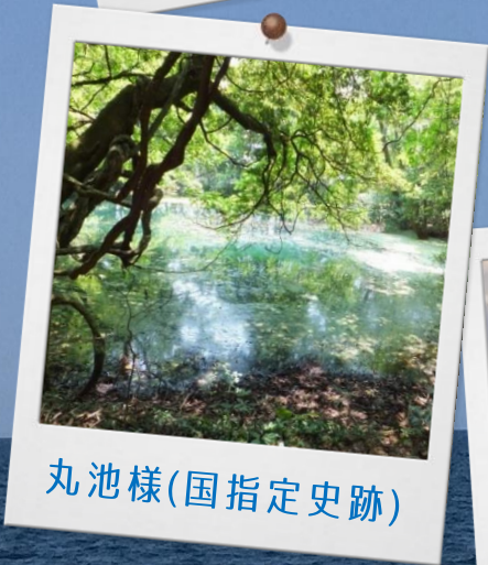
丸池様(国指定史跡)